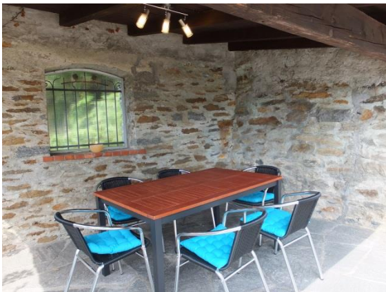
Frühstück im Grotto 2 mit Morgensonne