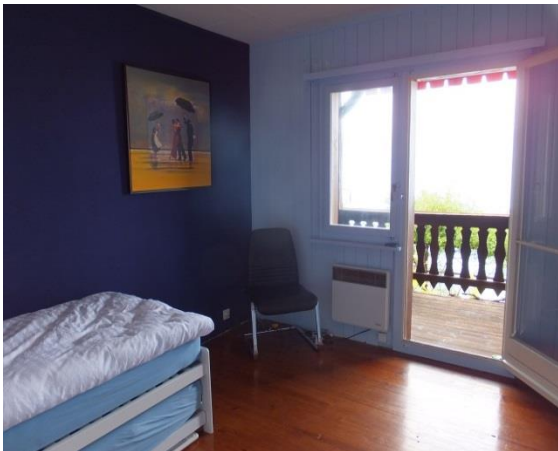
Chambre bleue - mit Aussicht + Terrassenzugang