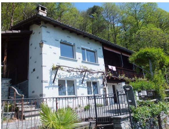
Ferienhaus Bella Vista in Monte Brè sopra Locarno