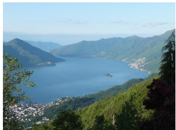
Atemberaubende Weitsicht auf den Lago Maggiore