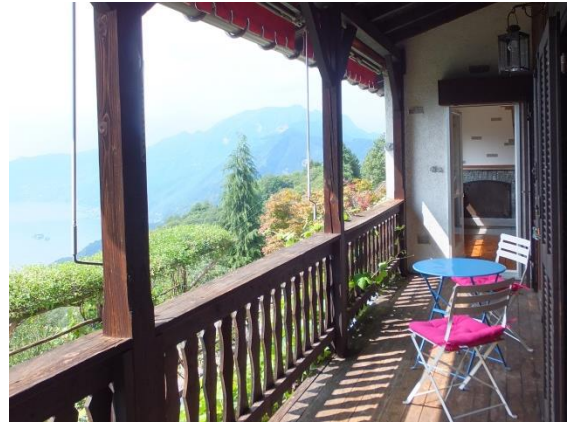
Auf der Veranda mit See- und Weitblick