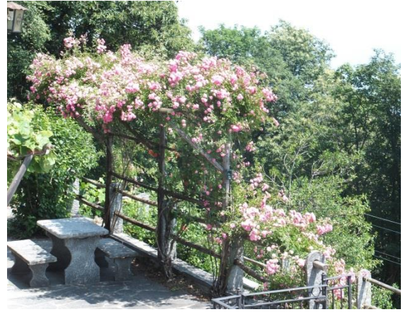
Apéro oder Lesestunden unter Rosen