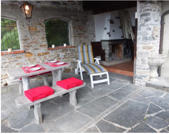
Frühstück im Grottino 1 mit Aussencheminee