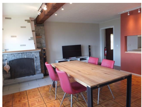
Essen & Wohnen: Licht und Raum nach sanfter Renovation