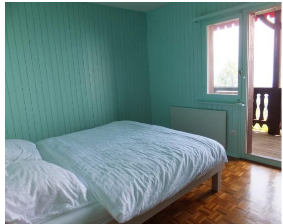
Chambre turquoise mit Aussicht + Terrassenzugang