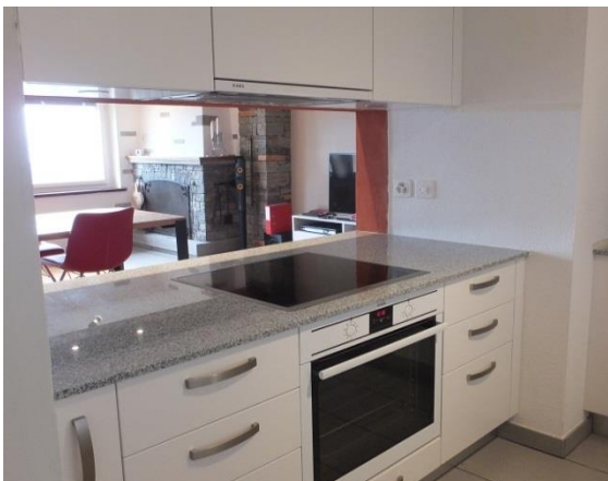
Wo kochen und geniessen Freude macht