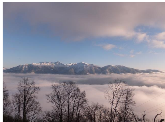
1005 m ü. Meer über den Wolken an der Sonne