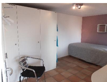
EG Zimmer mit eigenem Badezimmer