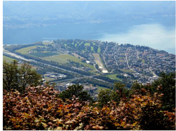
Und immer diese Aussicht – das Maggia-Delta