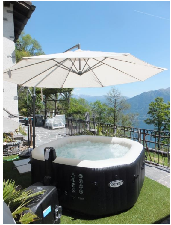
Salzwasser Whirlpool zum Entspannen Tag + Nacht