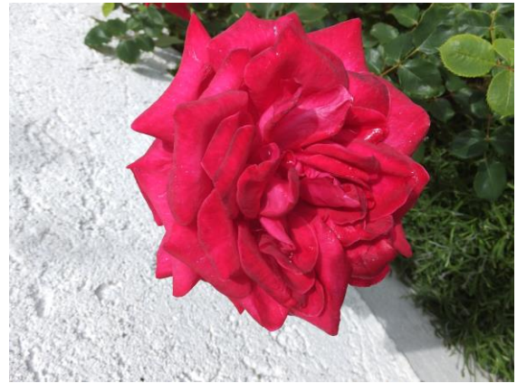
Farben im Garten