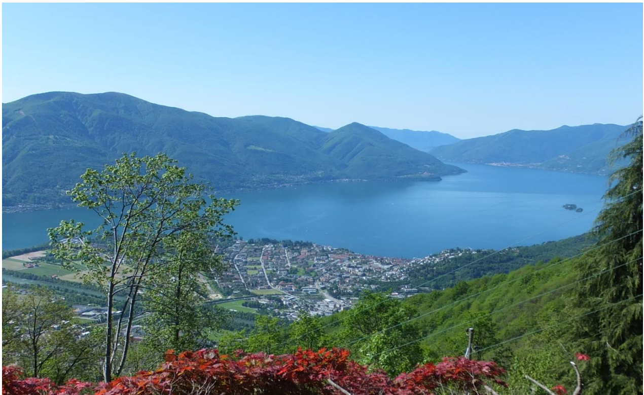
240°Aussicht vom Haus Bella Vista auf Lago Maggiore, Locarno, Ascona, Brissago Inseln und bis weit nach Italien