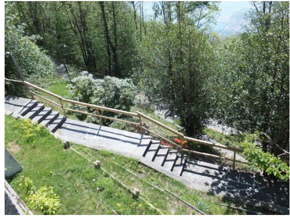
Der Weg zum Ziel