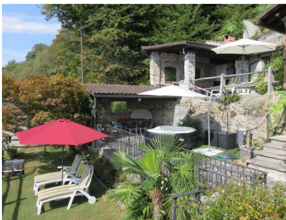
Relaxen auf einer von 5 geschützten Terrassen