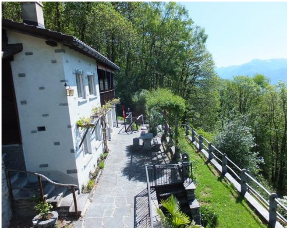
Sonnenlage Ferienhaus Bella Vista mit frischer Luft