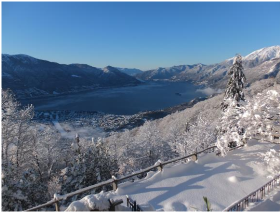
Sonnenstube im Winter