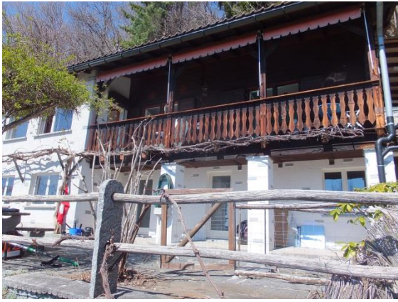
Haus Bella Vista – mit Ausblick von der Veranda