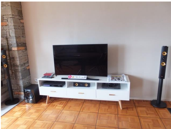
Internet, WLAN, 3x TV & Radio per Satellit