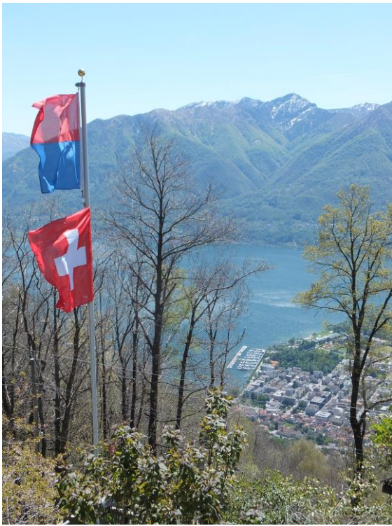
Thermik Wind und mit Blick den Hafen Locarno