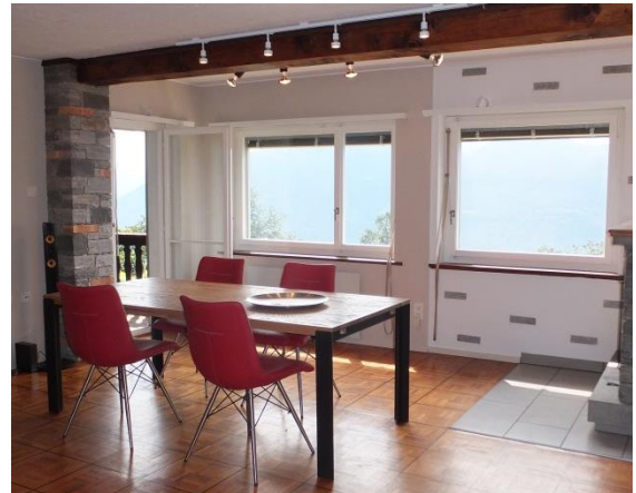
Sanft renoviert - modern mit viel Licht und Aussicht