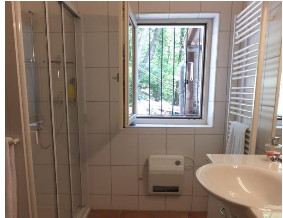
Modernes Badezimmer mit Bodenheizung