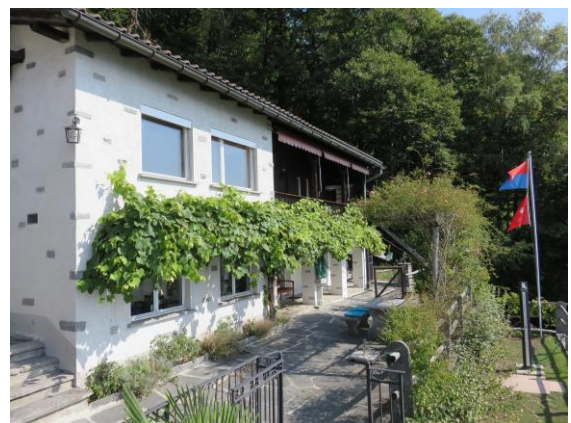
Ein Tessinerhaus mit bald 80 Jahren Bau-Geschichte