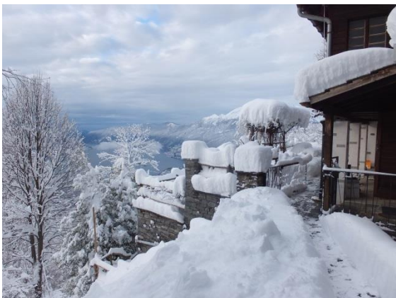
Winterstimmung ist im Süden zauberhaft